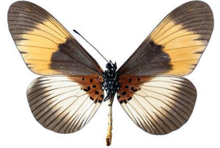
adrasta, mâle, verso, Nguru Mts - Maskati fst, Tanzanie, 61.JPG adrasta