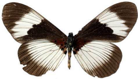
adrasta, femelle, verso, Tanga (Tanzanie) 74.JPG adrasta