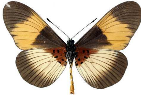
adrasta, mâle, verso, Dodoma, Tanzanie, 57.JPG adrasta