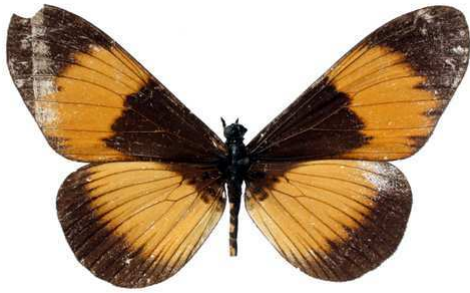
adrasta, Tanga (Tanzanie) 61.JPG adrasta