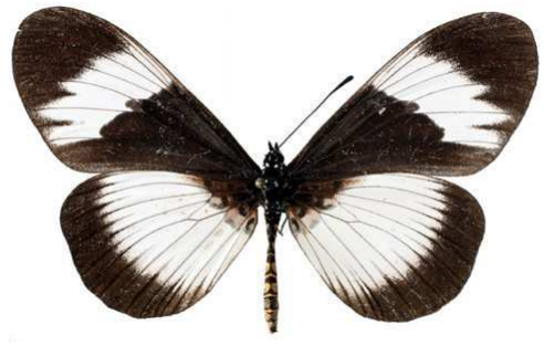
adrasta, femelle, recto, Dodoma, Tanzanie, 70.JPG adrasta