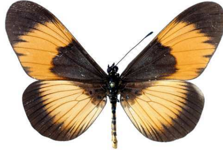
adrasta, mâle, recto, Nguru Mts - Maskati fst, Tanzanie, 61.JPG adrasta