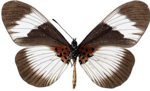
adrasta, femelle, verso, Dodoma, Tanzanie, 70.JPG adrasta