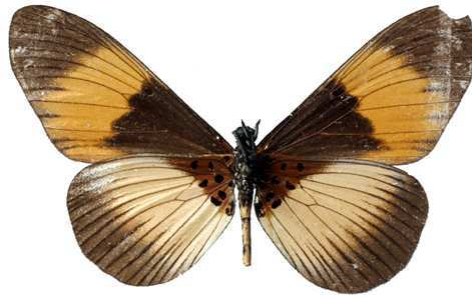
adrasta, verso, Tanga (Tanzanie) 61.JPG adrasta