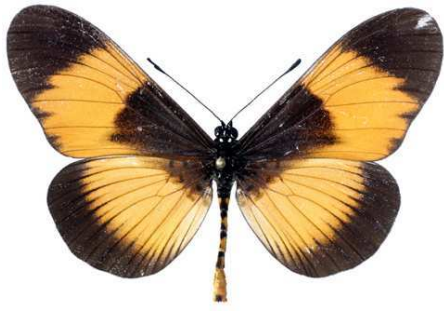
adrasta, mâle, recto, Dodoma, Tanzanie, 57.JPG adrasta