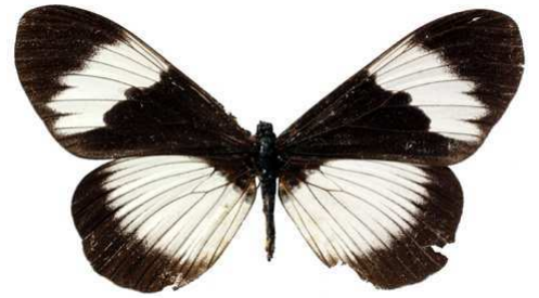
adrasta, femelle, Tanga (Tanzanie) 74.JPG adrasta