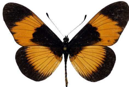
adrasta, Usambara, Tanzanie Bernaud (Cat EB).jpg adrasta