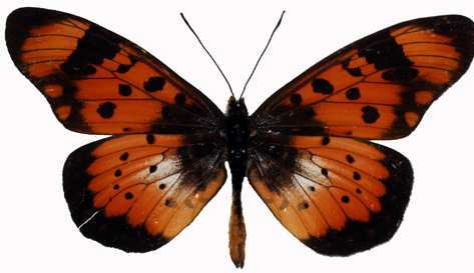
acara mâle, Namitembo stream - Zomba (Malawi) RM.jpg caffra