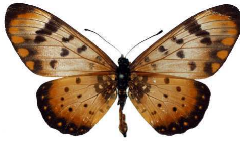
acara, femelle, Zanzibar, Tanzanie MNHN (Cat EB).jpg acara