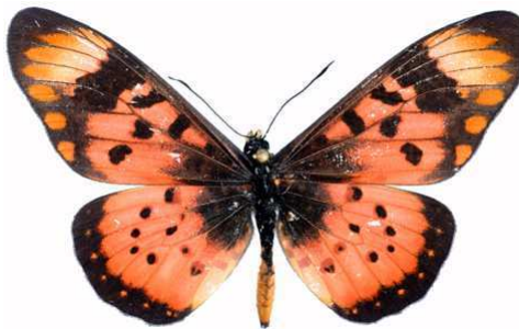
acara mâle, Zavô - Nyika (Malawi).jpg acara