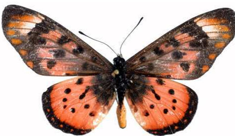
acara mâle 2, Zavô - Nyika (Malawi).jpg acara