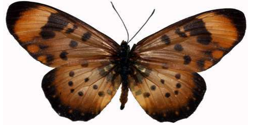
acara femelle, Mangoschi (Malawi) RM.jpg acara