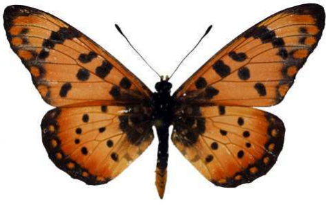
acara, Mombasa, Kenya MNHN (Cat EB).jpg acara