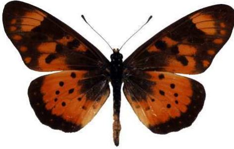
acara mâle, Chinteché - Chisasira fst (Malawi) RM.jpg acara