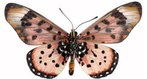
acara mâle 2 verso, Zavô - Nyika (Malawi).jpg acara