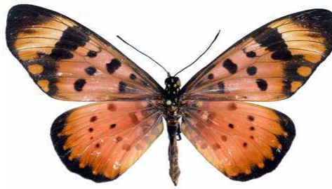
acara femelle, Mughese fst (Malawi).jpg acara