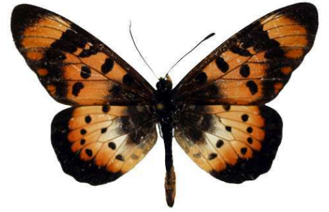
acara, Harare, Zimbabwe Bernaud (Cat EB).jpg caffra