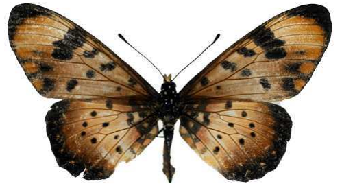
acara femelle, Chikwawa (Malawi).jpg acara