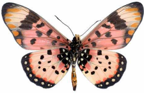
acara mâle verso, Zavo - Nyika (Malawi).jpg acara