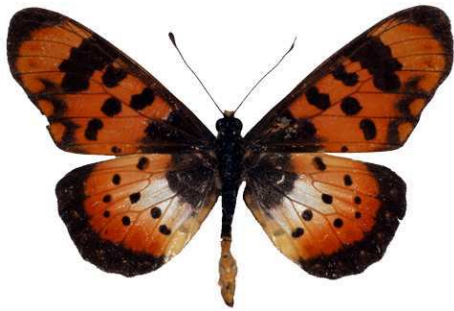
acara mâle, Mapatamanga - Shire river (Malawi) RM.jpg caffra