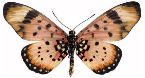
acara femelle verso, Mughese fst (Malawi).jpg acara