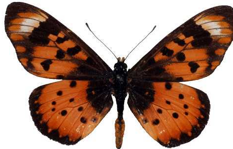
acara mâle, Nchorongo - Mzuzu (Malawi) RM.jpg acara